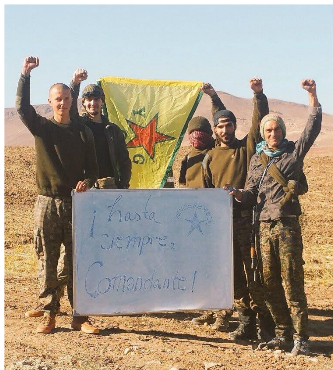
De soi-disant « internationalistes » engagés dans les milices YPG rendent hommage à Fidel Castro ! Tout un programme...

Sur cette fin peut-être un peu abrupte, mais dans l'attente de vos réactions, recevez bien des salutations. ★