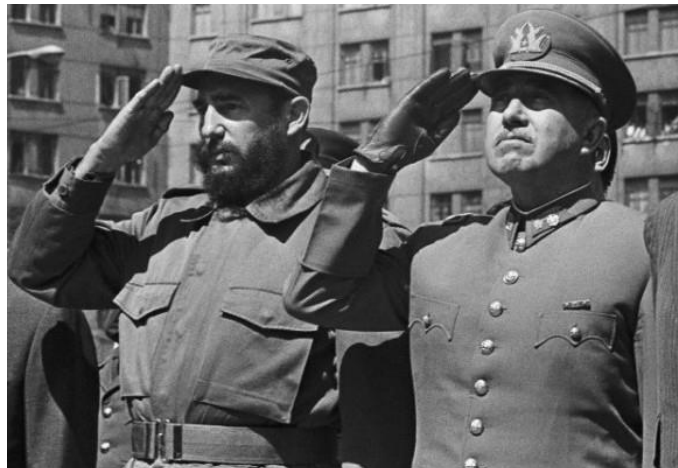
Deux contre-révolutionnaires saluent le même drapeau... celui de l'Etat bourgeois : le « fasciste » Pinochet côte à côte avec l'« antifasciste » Castro en visite en 1971 dans le Chili d'Allende et de « l'expérience socialiste »...