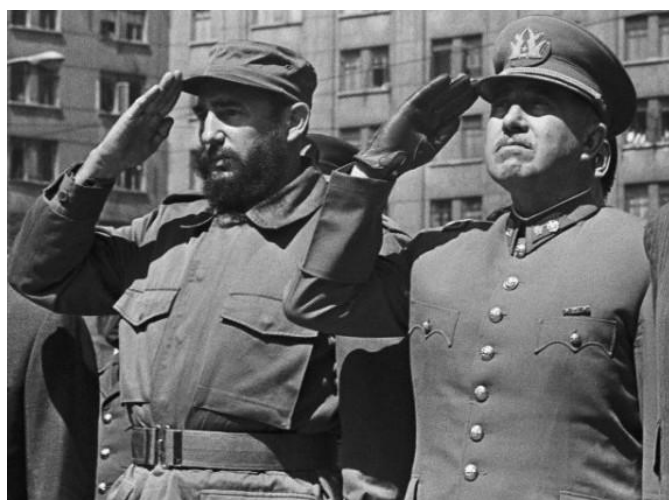
Dva kontrarevolucionáři zdraví stejný prapor... prapor buržoazního státu: „fašista“ Pinochet bok po boku s „antifašistou“ Castrem na návštěvě Chile Salvadora Allendeho a „socialistické zkušenosti“ v roce 1971...