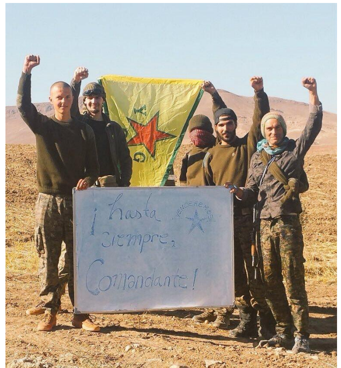
Takzvaní „internacionalisté“, členové milic YPG, vzdávají hold Fidelu Castrovi! Jaký program...

Tímto snad poněkud strohým závěrem a v očekávání vašich reakcí vás zdravíme. ★