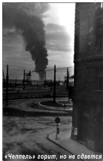
«Чепель» горит, но не сдается

На первом заседании ЦРС (14 ноября) избранный председателем Шандор Рац заявил: «Нам не нужно правительство! Мы руководители Венгрии и останемся ими!» К сожалению, большинство склонялось к компромиссу и переговорам с марионеточным прокремлевским правительством Кадара.