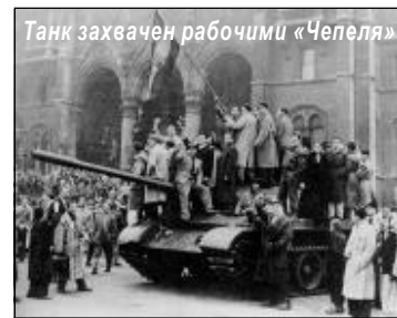
Танк захвачен рабочими «Чепеля»