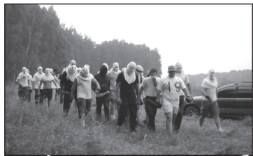
Это фашисты и менты «разбираются» со старым движением

28 июля 2010 г. около 500 антифашистов и анархистов атаковали здание администрации подмосковного города Химки. В здании были выбиты стекла, оно было обстреляно из травматического оружия. «Мы напали на здание, так как там скопились силы зла в виде наемных бандитов, милиционеров и футбольных хулиганов. Конечно, мы не можем помешать вырубке Химкинского леса - это уже невозможно. Но это совсем не справедливо, мы не желаем мириться с этим», - сказал источник в интервью.