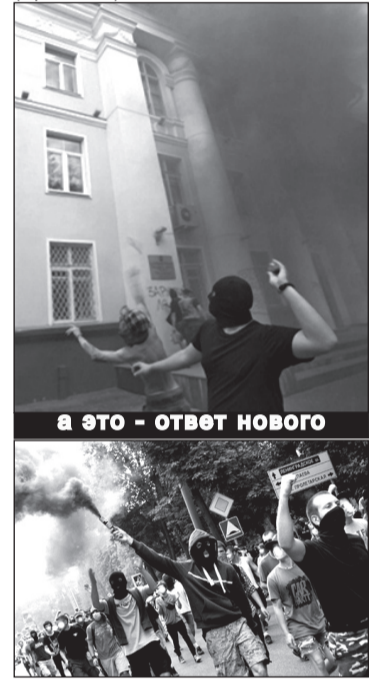
А ЭТО - ОТВЕТ НОВОГО

1 Станным представляется лозунг анархо-антифа: «защитим русский лес». Разумеется, любой человек имеет право считать себя хоть русским, хоть татарин, хоть осетин. Но в Москве и в России живут не только русские. Леса принадлежат всем, а не какому-то отдельному народу. Лозунги, способные разделить людей по национальному признаку, противоречат логике движения, которое утверждает, что борется против национализма и за радикальное всеобщее освобождение. (Прим. авт.)